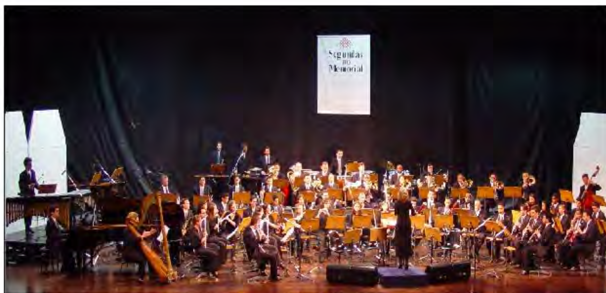
A Banda Sinfônica Jovem do Estado no Memorial